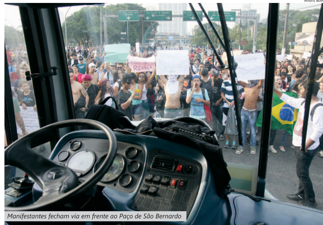
Manifestantes fecham via em frente ao Paço de São Bernardo

Apesar da redução, militantes do Movimento Passe Livre reafirmaram que vão seguir mobilizados no sentido de conquistar a tarifa zero, garan-